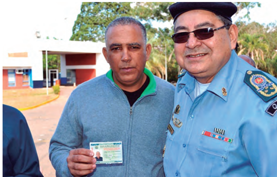
O evento foi abrilhantado com a presença de policiais, tanto da ativa como da reserva

Representando toda a tropa da PMMS, os policiais militares da ativa e inatividade receberam identidade digital e com inovações. As funcionais dos policiais militares antes valiam por apenas 5 (cinco) anos, agora não mais têm prazo de validade, sendo que os