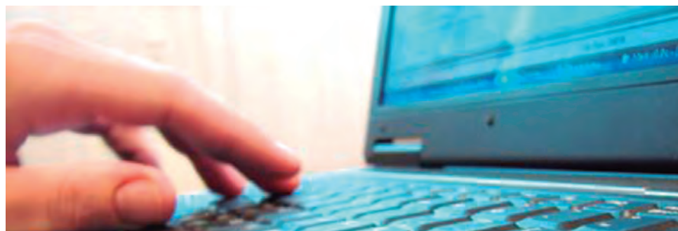
Terceirizações na área de informática são um problema antigo no Detran-MS

II Foi publicado do Diário Oficial do Estado do dia 31 de julho o resultado do pregão para 'contratação de empresa especializada para a prestação de serviços de implantação, manutenção e operacionalização de sistema computacional integrado ao sistema do Detran, para guarda e recuperação de contratos de financiamento de veículos com cláusula de alienação fiduciária, arrendamento mercantil, reserva de domínio ou penhor, com serviços de conferência de contratos, provendo interoperabilidade e operação segura'. A empresa vencedora da licitação foi a Master Case Digita Business Ltda, que apresentou um valor mensal de R$ 503 mil, o que representa um gasto anual com o serviço de pouco mais de R$ 6 milhões.