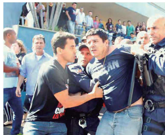
No dia 4 de agosto de 2015, os profissionais da educação foram agredidos por guardas civis municipais durante legítimo protesto da categoria na Câmara Municipal da Capital

A ACP convoca os profissionais da educação, os estudantes, a sociedade para a luta. Lutar pela valorização da vida, da educação e por um mundo onde prevaleçam o amor, a liberdade e a tolerância, para suplantarmos o ódio, a violência, a crueldade e a covardia.