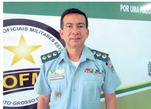
Vilassanti diz que sindicância é perseguição do Governo

“Me sinto humilhado ao ter cobrado por diversas vezes o que o governo prometeu fazer. Nunca fui punido ou processado durante minha carreira de mais de 30 anos. Este é um governo